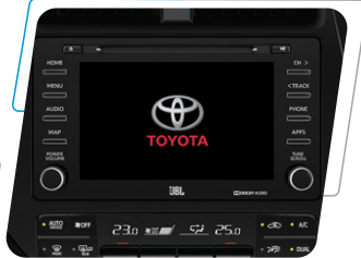
Touchscreen JBL DE 7" con AM/FM, CD, DVD, MP3, USB, BT y AUX