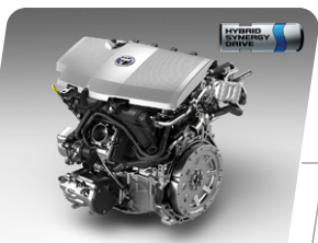
Tecnología Híbrida: Potencia máxima total 121 hp