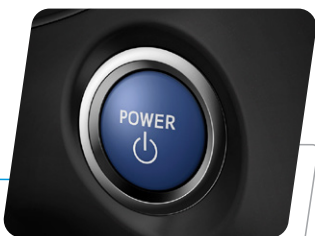
Engine Start (Encendido por botón)