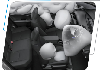
Airbags: Piloto, copiloto, laterales, de cortina y rodilla