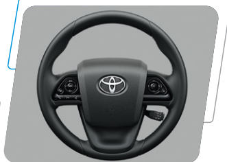
Timón con controles de audio, bluetooth y panel multi-información