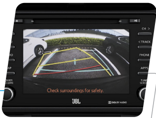
Cámara de retroceso para estacionamiento