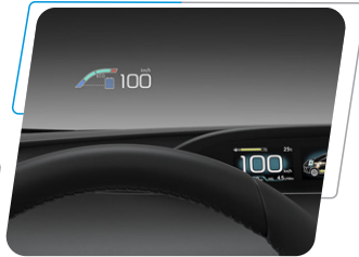
En parabrisas frontal - Head Up Display (HUD)